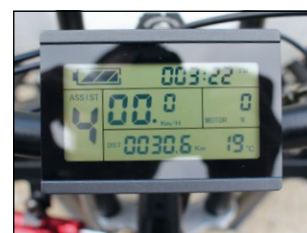
• Écran LCD de commande