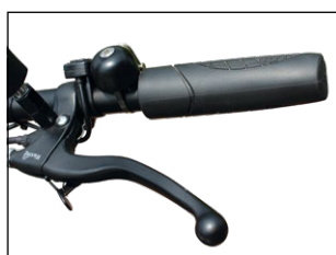
• Levier de frein parking