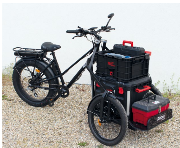
Le triporteur utilitaire BICYPRO® optimisé pour les professionnels : transport de marchandises, livraisons...

Avec une largeur de 88 cm , le triporteur peut être utilisé dans les zones piétonnes et urbaines . Il a été étudié pour passer notamment entre les poteaux de sécurité des villes (écartement de 90 cm).