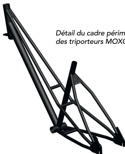
Détail du cadre périmétrique des triporteurs MOXO.

Basé sur la mobylette motorisée AV3 de 1953, le cadre périmétrique en acier du vélo comporte 3 tubes qui assurent un meilleur contrôle de la trajectoire et plus de rigidité et de solidité . La peinture époxy du cadre garantit une utilisation extérieure de 10 ans.