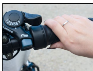
• Poignée d'accélération et vitesses