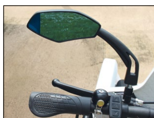
• Rétroviseur gauche